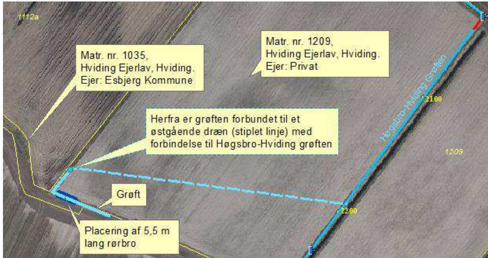
Figur 1. Placering af privat grøft og dræn med afløb til det offentlige vandløb Høgsbro-Hviding Grøften. Rørbrøen ønskes placeret øst for grøftens 90 graders sving.